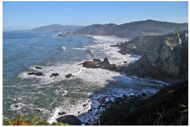
Punta da Ribeira coa praia do Sarridal ao fondo