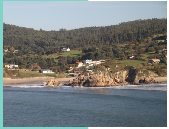
Pena Castelo, entre as praias de Mazorgán e O Eirón