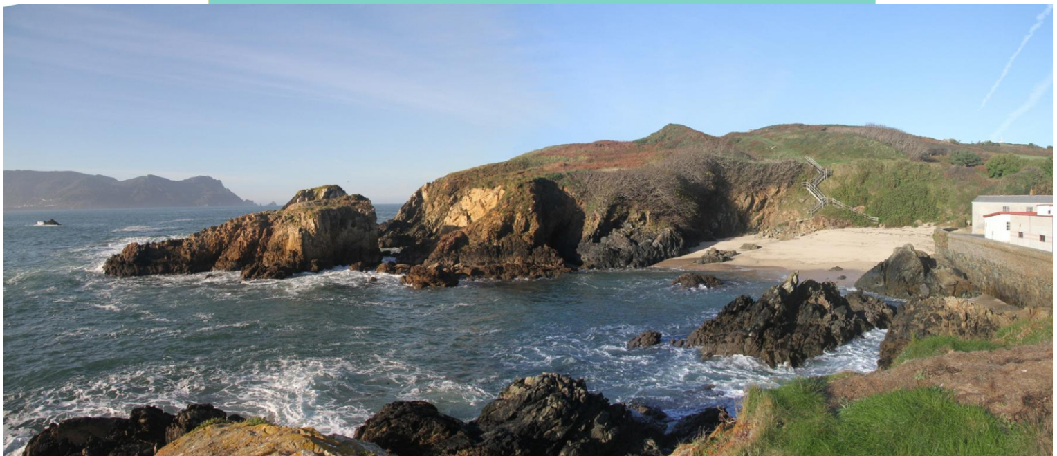
Punta dos Prados, co castro e a praia de Santa Cristina