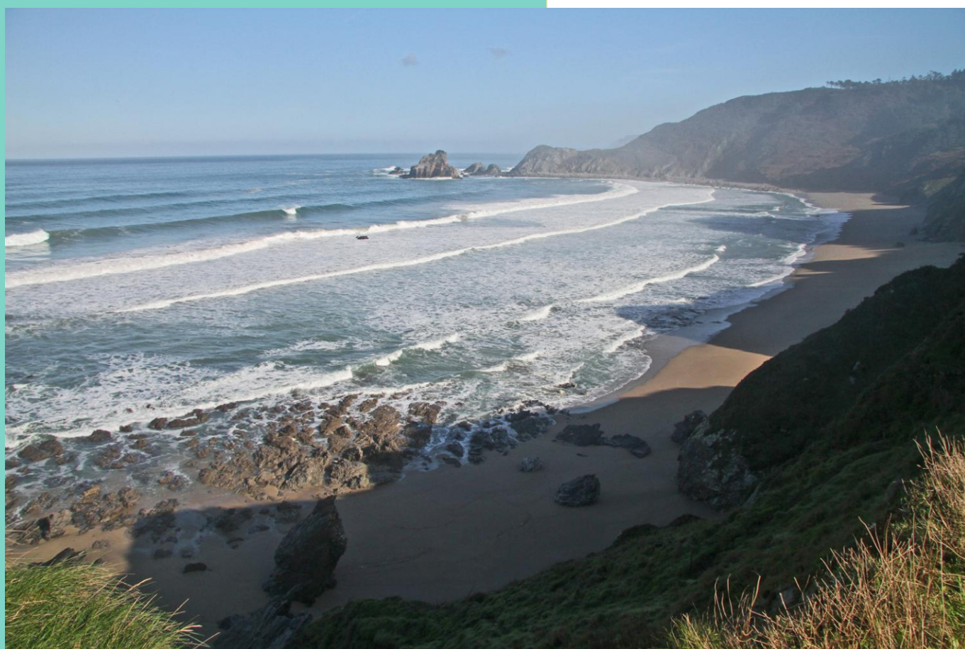
Praia do Sarridal