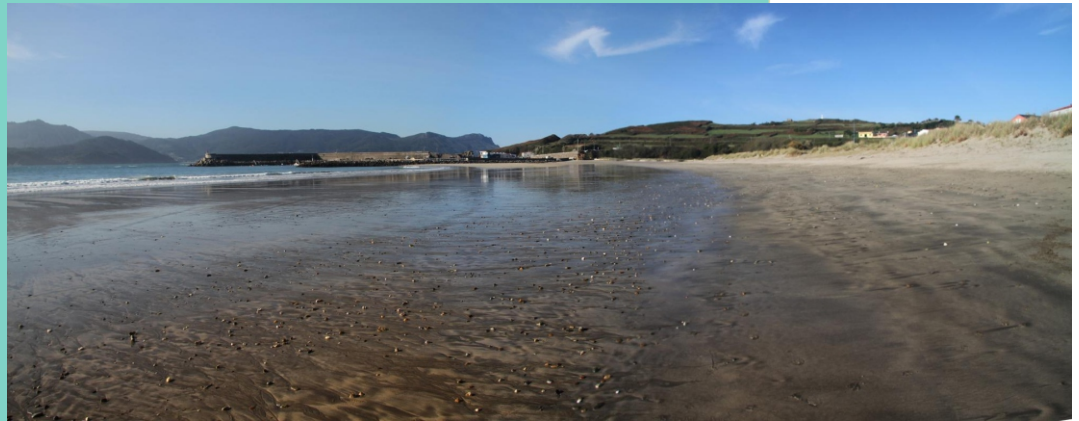
Praia de Espasante. Coñécese tamén cos nomes de A Cuncha e Santa Eulalia e mide algo máis de 1 km de lonxitude.