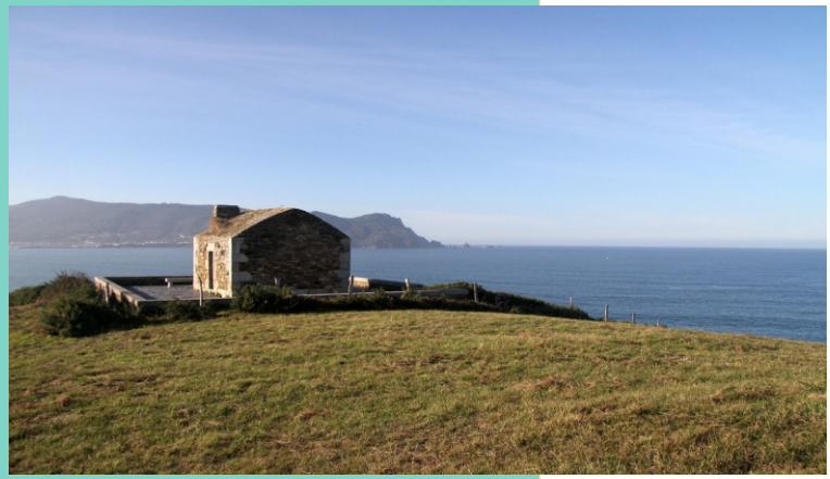
20-Casa da vela no cume do monte de San Antón, desde onde hai panorámicas de toda a costa da contorna. Esta construción formaba parte dun sistema de vixías situado en puntos estratéxicos da costa para avisar no caso de ataques que funcionou desde o século XVI.