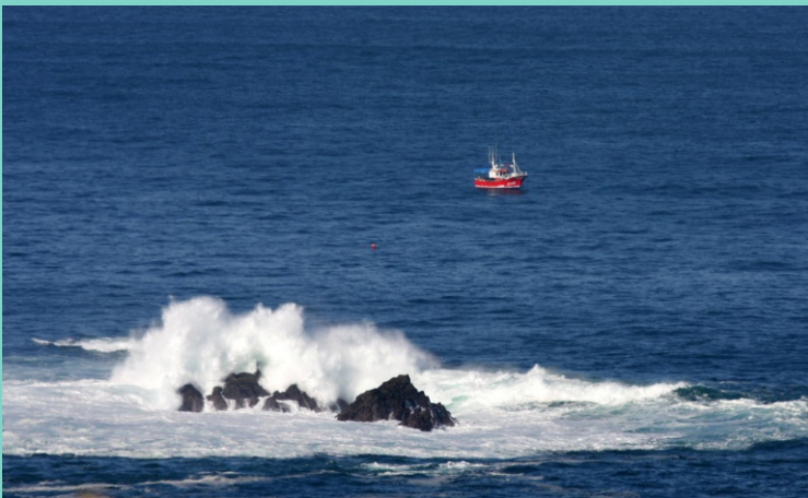
A Pedra Meá desde a punta da Bandexa