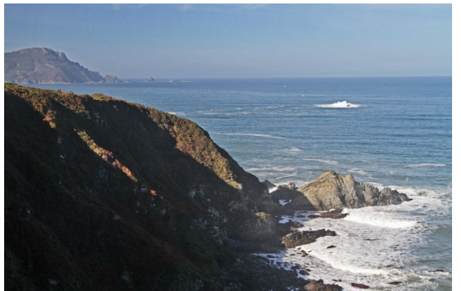
Punta da Bandexa