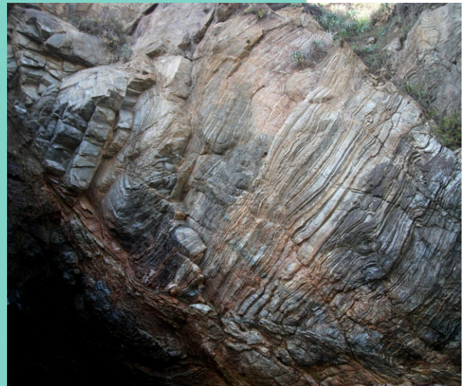
Na praia de San Antón hai formacións rochosas de gran interese: basaltos, lavas almofadadas... procedentes de erupcións submariñas do Paleozoico e xistos con pregamentos.