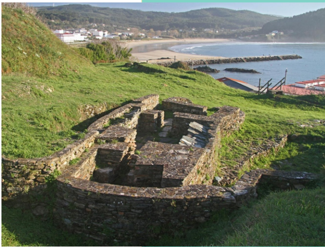
Castro da Punta dos Prados. Construción de uso termal.