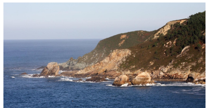
Puntas da Bandexa e Barrosa, e Os Castelos