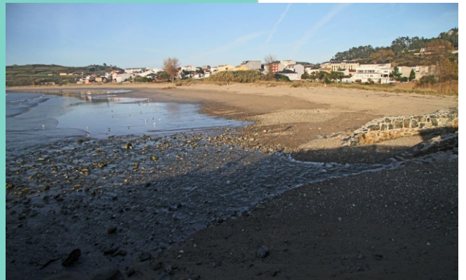
Praia de Espasante e desembocadura do río Dola