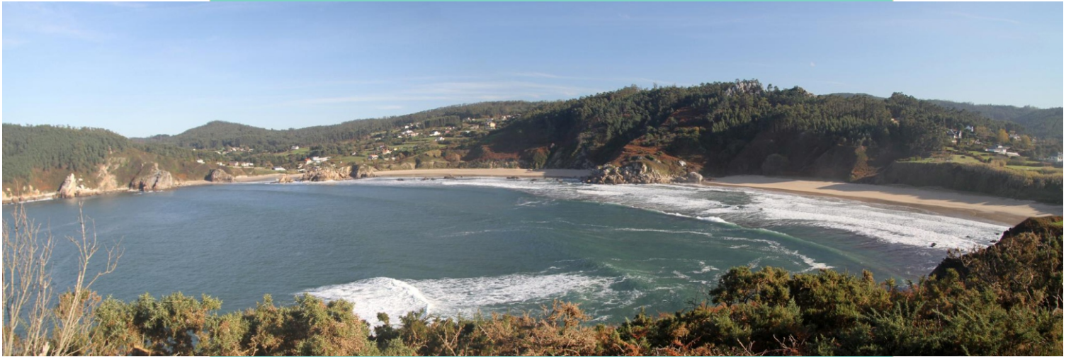
Vista desde a punta dos Prados: praias de Mazorgán, Eirón e San Antón