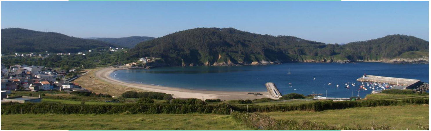
Enseada de Espasante desde o monte de San Antón