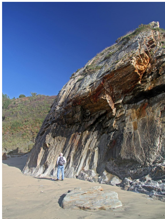
Rochas na praia de Arxúa (Mazorgán)

Unha camiñada para seguir coñecendo o litoral de Ortigueira nas parroquias de Céltigos e Espasante nos que se suceden os cantís e os areais. Unha costa dun enorme interese xeolóxico (variedade de rochas e de formacións), paisaxístico, ecolóxico (ecosistemas, flora e fauna pouco comúns...) e histórico-etnográfico (embarcacións, construcións tradicionais castros, ...) Unha parte está protexida no LIC "Estaca de Bares".