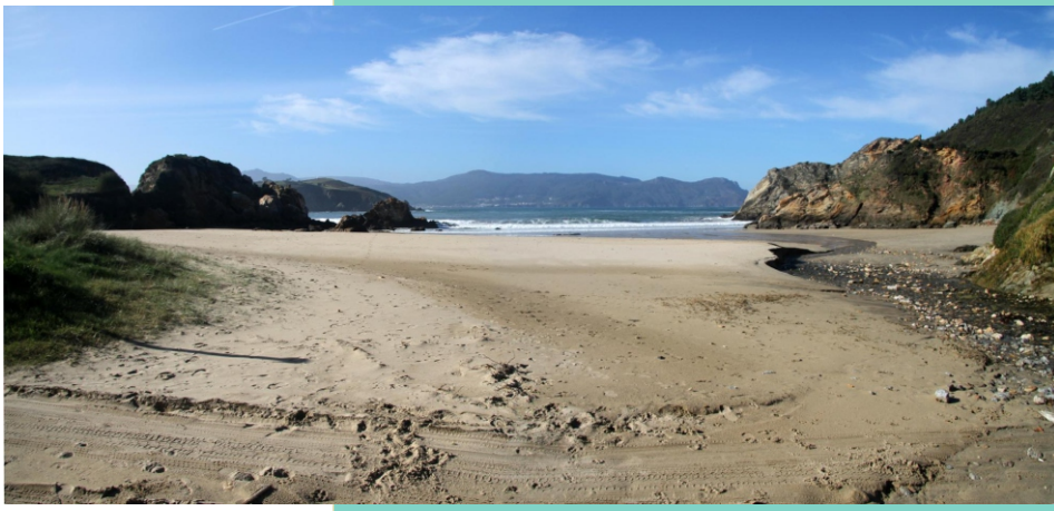
Praia de Mazorgán ou do Bimbieiro