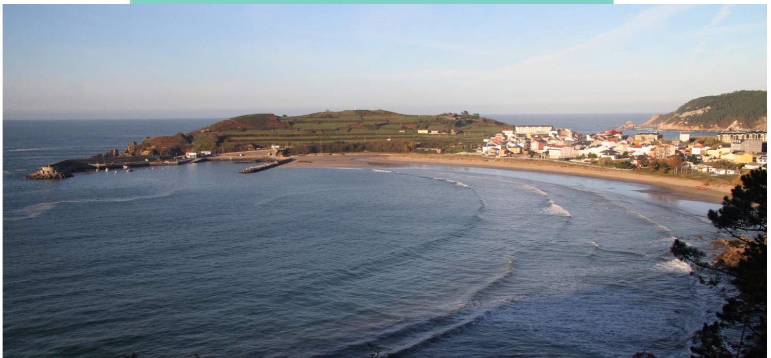
Enseada de Espasante