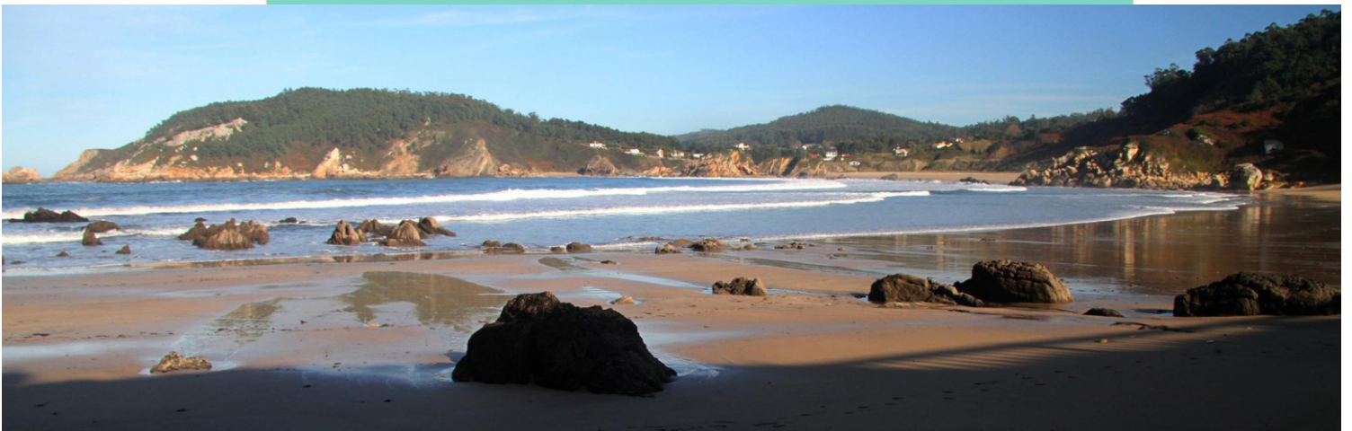
Praia de San Antón e punta da Bandexa