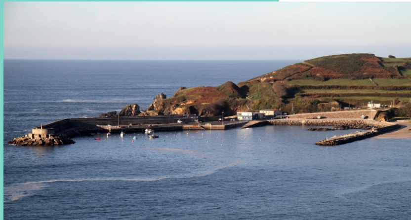
Porto de Espasante