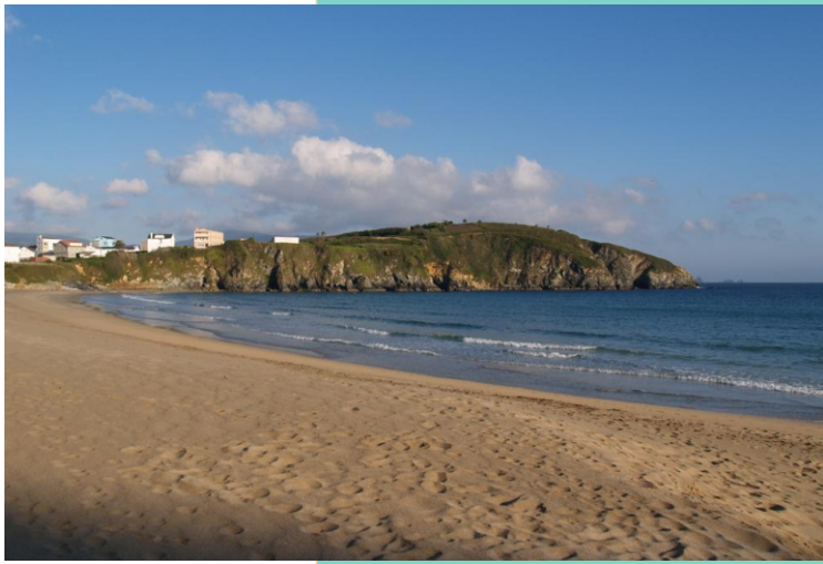
Vista do monte de San Antón e a punta dos Prados desde a praia de San Antón