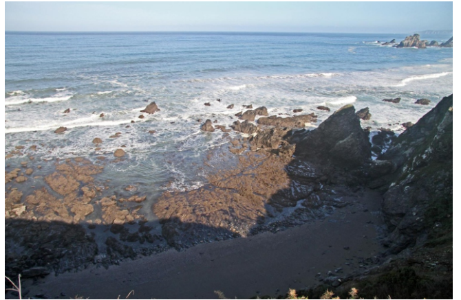
Punta e praia da Ribeira